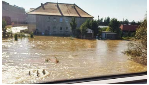
LLIFOGYDD O'R TREN