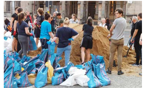
YR IFANC AR WAITH