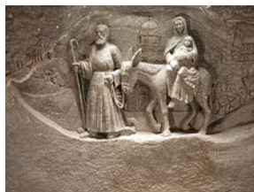
Y GENI MEWN CLODDFA HALEN