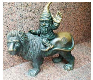
CORACHOD YN EIN DIOGELU