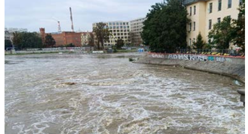
Y DWR YN BYGWTH