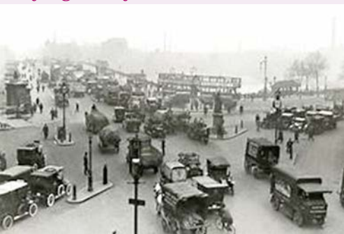
Traffig can mlynedd yn ôl

O fyd gwleidyddiaeth: Robert Mugabe (2019) a George H. W. Bush (2018).