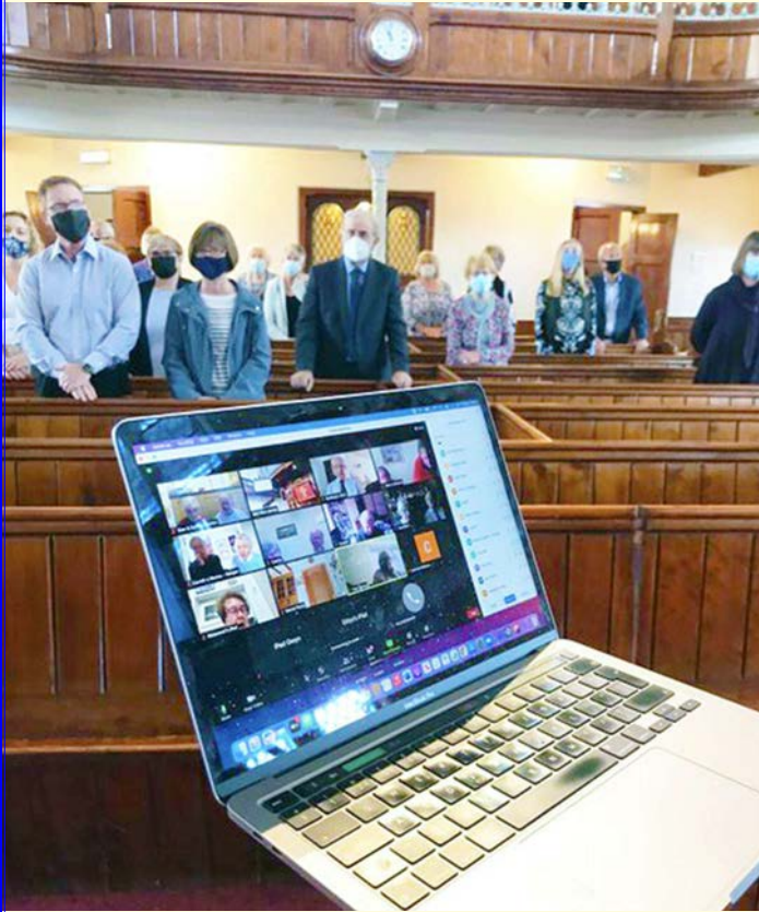
Cynulleidfa Y Priordy yn y capel a chynulleidfa Emaus ar Zoom