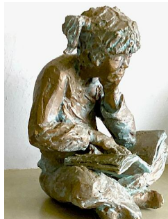
DYMA UN O'N WYRESAU'N DARLLEN

Bu hefyd yn diwtor dosbarthiadau paentio dyfrlliw allanol y brifysgol yma am dros 18 o flynyddoedd. Yn ychwanegol i'w phaentio, mae wedi gwneud nifer o gerfluniau.