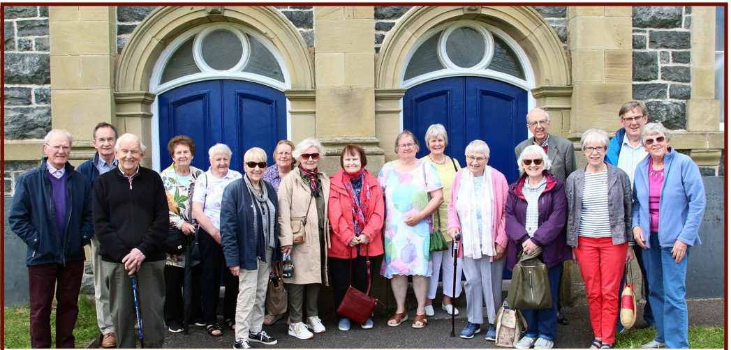
O FLAEN YR HEN GAPEL