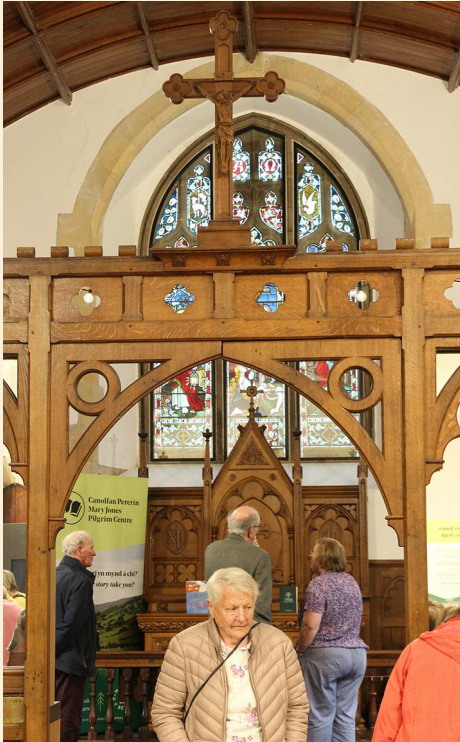
YR EGLWYS WEDI'I HADDURNO'N GELFYDD

Elfen arall o'r ganolfan ydy'r gofod atyniadol a neilltuwyd i blant. Yno mae sgriniau cyffwrdd a lle i'r plant liwio.