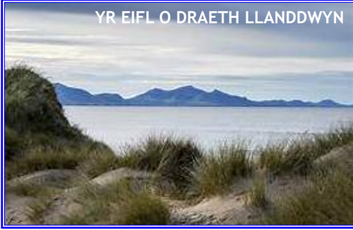
YR EIFL O DRAETH LLANDDWYN