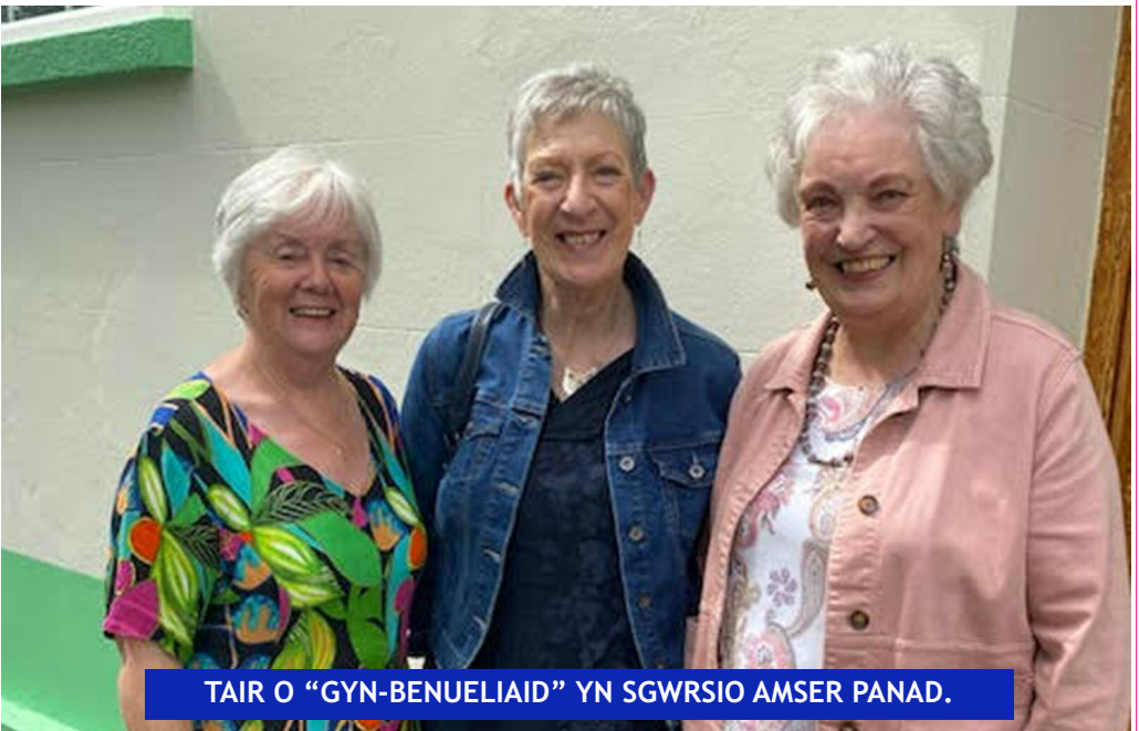
TAIR O "GYN-BENUELIAID" YN SGWRSIO AMSER PANAD.