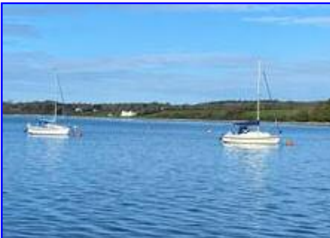
MOEL Y DON O'R FELINHELI

Yn y lolfa yn Llanddaniel mae gen i brint o un o luniau Kyffin Williams brynwyd gan Mam rai blynyddoedd yn ôl. Mae'n ddarlun mewn du, gwyn a gwyrdd gyda'r artist ar ochr Sir Fôn i'r Fenai yn edrych draw ar yr Eifl yn y pellter. Dros y blynyddoedd diwethaf, mae'r llun wedi aros yr un peth ond ei arwyddocâd wedi newid. Pan brynwyd y llun, roedd Môn ymhell a'r Eifl yn agos ond erbyn hyn dwi'n byw yn Sir Fôn heb fod ymhell o leoliad yr arlunydd wrth baentio ei lun. Mewn ffordd rhyfedd felly, mae fy mywyd go iawn wedi dal i fyny gyda stori'r llun.