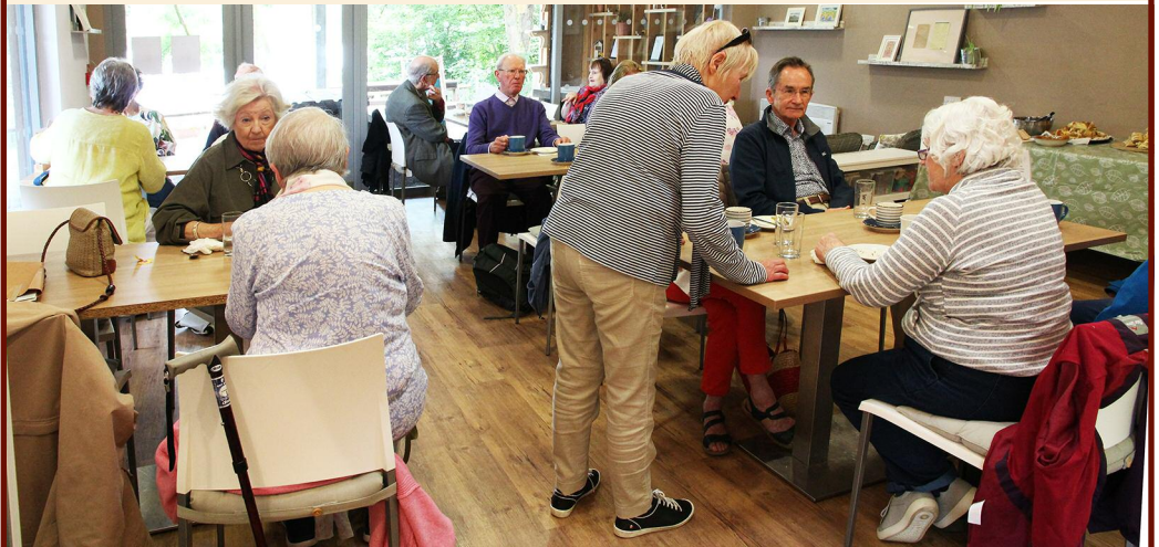
CINIO BLASUS GER YR EGLWYS