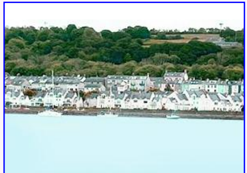
Y FELINHELI O MOEL Y DON