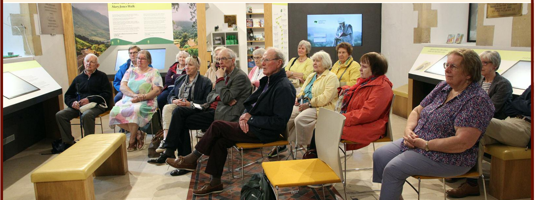
GWRANDO'N ASTUD AR Y CYFLWYNIAD